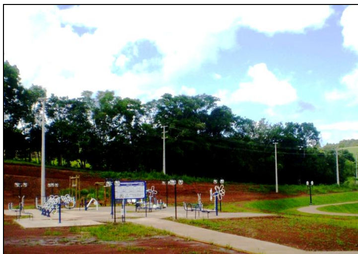
Imagem 3 – Vista parcial da Academia de Terceira Idade no Parque do Lago de Mamborê.

Ao lado do estacionamento encontramos uma Academia da terceira idade (A.T.I.), imagem 3. Paralelo a entrada do estacionamento existe uma calçada para levar à ATI. Nesta encontra-se os seguintes equipamentos: um rotação vertical; um rotação dupla diagonal; três cavalgada; um leg press ; três simuladores de caminhada; dois elípticos; um remada convergente; um alongador alto e um multifunção. Na área ocupada pelos equipamentos da A.T.I., o solo é concretado (blocos de concreto com algumas pequenas áreas ajardinadas). Ainda no local existem três bancos de metal e três lixeiras permeáveis em metal.