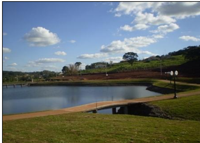
Imagem 4 – Vista parcial da infraestrutura do Parque do Lago de Mamborê.

Na área entorno ao lago (imagem 4) encontra-se 19 luminárias baixas tipo jardim. A pista de caminhadas tem 730 metros de extensão e 2,70 de largura. Além disso, 11 lixeiras encontram-se espalhadas ao redor do lago, quatro academias, seis bancos, e toda área as margens do lago é coberta por gramado rasteiro. Ainda com relação ao lago ao centro dele existe uma pequena ilha portando uma grande luminária (imagem 5) e tendo como acesso a ela duas pontes, uma em construção e outra (em madeira) concluída.