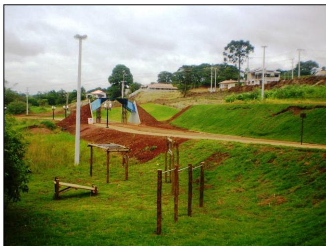
Imagem 2 – Vista parcial da mini academia no Parque do Lago de Mamborê

Adentrando ao parque à direita encontramos uma espécie de mini academia (imagem 02) e encontra-se iluminada por altas luminárias presentes em postes de concreto com duas pétalas.