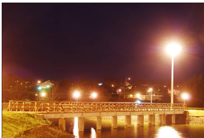
Imagem 5: Ponte concluída e iluminação existente na ilha localizada no centro do lago.

Entre o lago e a rodovia foram desmanchadas as construções existentes e o terreno esta sendo aterrado. Assim entre o lago e a Avenida Abel Desiderio de Araújo quatro postes padrão Copel fazem iluminação da área interna do parque próximo á área de reflorestamento ciliar.